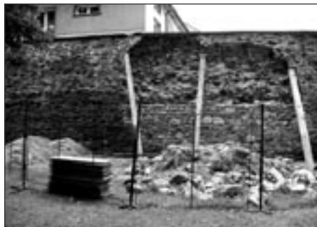
Hradby, oprava havarie úsek č. 18

zóna a v postranních částech budou parkovací plochy. I tento projekt připravuje město pro žádost o dotaci z Regionálního operačního programu NUTS II Severovýchod.