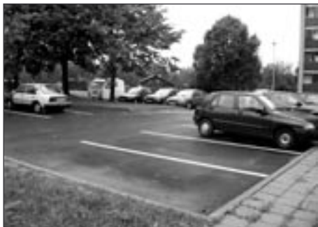
Parkoviště, ulice M. Bureše

V minulém roce proběhla I. etapa regenerace panelového sídliště M. Bureše, která se týkala především oprav komunikací, zhotovení nových kontejnerových stání, nového dětského hřiště za prodejnou potravin, kompletní výměny obrubníků mezi chodníky a komunikacemi a 2 nových parkovišť. Na I. etapu získalo město dotaci z rozpočtu Ministerstva pro místní rozvoj ČR (dále jen MMR ČR) ve výši 2,8 mil. Kč z celkového rozpočtu 4,2 mil. Kč.