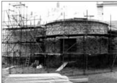
Hradby, oprava úseku č. 22 II

V oblasti technické infrastruktury je záměrem města rekonstrukce povrchu Palackého náměstí, které bude vydlážděno žulovými kostkami. V dolní části náměstí se bude nacházet malá odpočinková