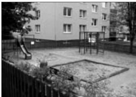
Dětské hřiště, ulice M. Bureše

V letošním roce bude navazovat II. etapa, ve které bude zahrnuto z části i sídliště Švermova, kde bude rozšířeno parkoviště na ulici Luční. Na sídlišti M. Bureše budou probíhat opravy chodníků (vydláždění zámkovou dlažbou), vegetační úpravy a opravy dětského hřiště u kotelny T.E.S. a za č.p. 807 – 809. Na tuto akci získalo město příslib o udělení dotace z rozpočtu MMR ČR ve výši 3,7 mil. Kč z celkového rozpočtu 5,3 mil. Kč. Předpokládaná doba realizace bude v měsících září – prosinec 2007.