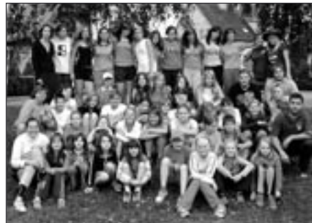
Posedmé v Česticích: účastníci

Volejbalový oddíl pořádal letos již posedmé soustředění mládeže v Česticích. Letošního se zúčastnila děvčata z minipřípravky, minivolejbalu a st. žákyně. Příjemné volejbalové prostředí i počasí nás provázelo celý týden. Všechna družstva tímto zahájila svoji přípravu na krajské přebory svých kategorií.