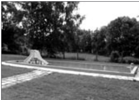
Dětské brouzdaliště, koupaliště