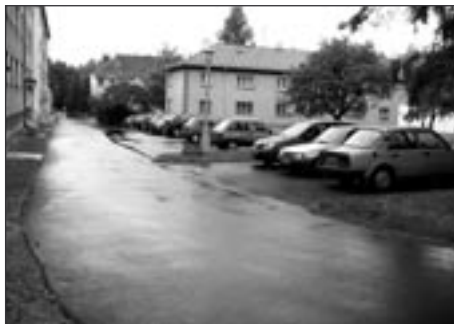
Komunikace, ulice Jiráskova