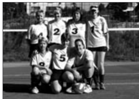
Ženy na turnaji v Písečné

Ženy TJ Spartaku Polička se 19. 8. zúčastnily tradičního poutového turnaje v Písečné. Nepodařilo se jim vylepsit loňské čtvrté místo, pouze ho zopakovaly. Přesto s umístěním nemohly být spokojeny. Předvedená hra byla plná chyb a nepřesností, což zabránilo ženám bojovat o první příčky. Prvenství si po zásluze odvezly ex-ligové juniorky z Nového Jířína.