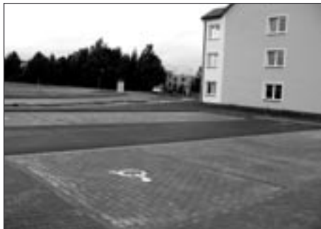
Komunikace + parkoviště, Mánesova IV