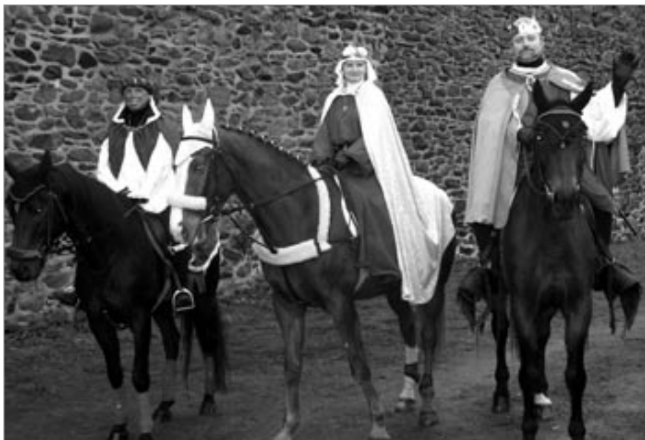
V sobotu 5. ledna 2008 projde Poličkou tříkrálový průvod koledníků vedených králi na koních. Přijměte u svých domovů tři krále a pomozte těm, kteří to potřebují.