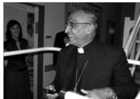
Arc. Moras zkouší výtah pro vozíčkáře