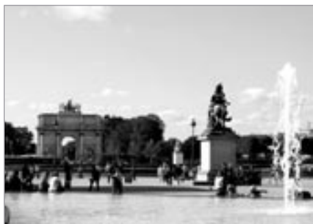
Od zbrad Tuileries

Toto není náhrada bedekru, chci se spíš vypsat z toho, co jsem viděl svými českými očima. Zámky Chambord, Villandry, Ambois, Chenonsay, Cheverny, Blois bez ohledu na to, zda jsou státní či soukromé, vás vítají jako milé hosty. Nikde se nepřezouváte, všude můžete fotografovat (i když bez blesku) a filmovat, přestože na stěnách visí originály Rembrandtovy, Corregiovy, Rubensovy atd. a tapiserie jsou zaručeně pravé bruselské. Chodíte po místnostech, kde měla svou pracovnu Kateřina Medicejská či Jindřich IV.