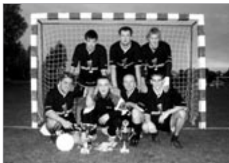
Vítězné družstvo Černoši