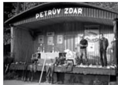
Pobled na ceny