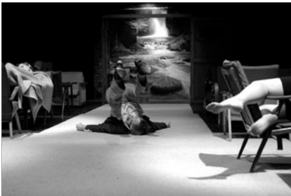
Z představení Mína z Barnbelmu v režii Marcela Škrkoně

Zkus to spočítat, než to dopišu (dopisují, Lenka se tak zvláštně drží pod nosem a přemýšlí).