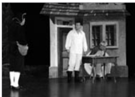
V 19 hodin začala premiéra Jiráskovy Lucerny