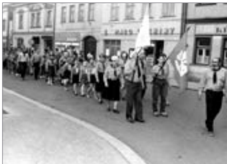
Stavění máje (1989)

První akcí, kdy jsme se představili poličské veřejnosti, bylo stavění Máje a pak večer 8. května, kdy jsme zahajovali lampiónový průvod ve skautských krojích a s pochodněmi. Náměstí