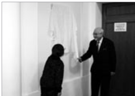
Celé odpoledne zabýjalo slavnostní odbalení pamětní desky věnované 80. výročí otevření Tylova domu.

Nedělní odpoledne 25. října patřilo poličským ochotníkům. Slavili 80. výročí otevření Tylova domu a 190. výročí divadelnictví v Poličce. Vzhledem k termínu uzávěrky Jitřenky přinášíme tuto krátkou fotoreportáž a v prosincovém čísle se můžete těšit na obsáhlý materiál.