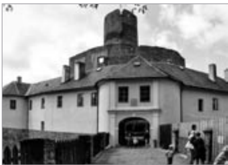
Obnovené fasády hradu

Hrad Svojanov měl v letošním roce rekordní návštěvnost. Jeho prostory si přišlo prohlédnout více než 46 000 návštěvníků. Díky tomu se stal nejnavštěvovanějším z hradů a zámků Pardubického kraje. V hradní ubytovně strávilo různě dlouhý pobyt 2 500 ubytovaných hostů. V areálu hradu proběhlo 40 svatebních obřadů.