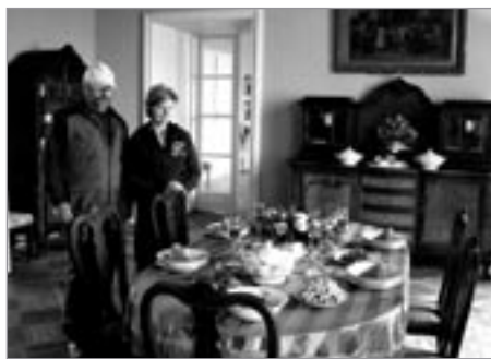
Nová instalace v hradní jídelně

Rovněž došlo k odbornému ošetření všech stromů, rostoucích v areálu hradu. V následujícím období je plánována celková oprava sociálního zařízení pro veřejnost a také obnova omítek zříceniny renesančního paláce, na kterých by měly být v náznacích provedeny i fragmenty renesančních psaníčkových sgrafit, jež byly necitlivě odstraněny na konci 80. let