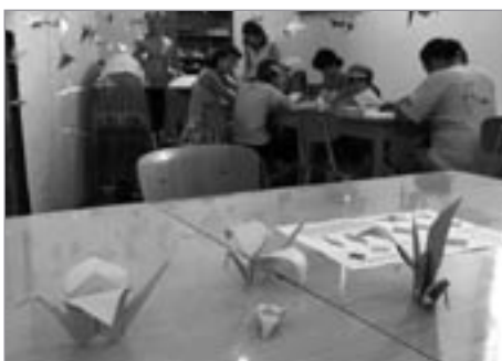
Kdo chtěl udělat dobrý skutek, složil takovéto origamové jeřábka.