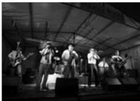
Los Chuperos byli se svým rege číperos.