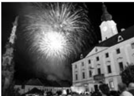
Bez působivého obňostroje by to už ani nešlo. A když vyjde i počasí...