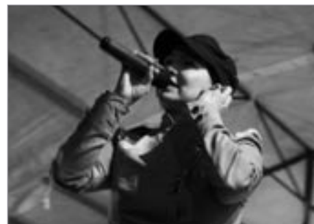
Annu K jsme viděli obzvláště rádi a stejně rádi jsme poslouchali její zpěv. Museli jsme si říci: „Co jsme chtěli slyšet, to jsme uslyšeli“.