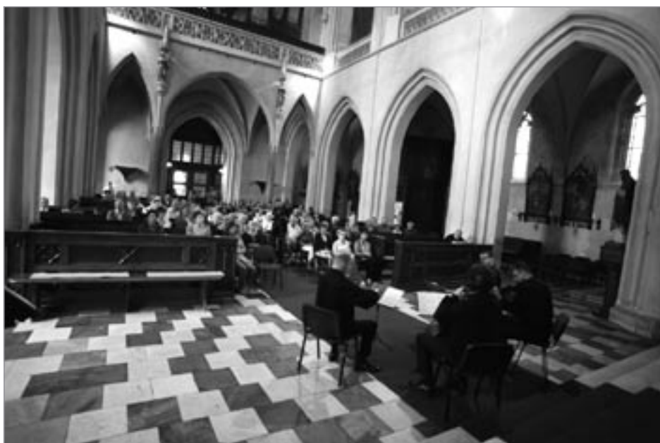
Klasický závěr je vždy důstojným vyvrcholením festivalu *555. České smyčcové kvarteto M. Nostitz Quartet zabýjilo skladbou J. Haydna – smyčcovým kvartetem d moll. Skladba v chrámovém prostoru zněla jak v podání celého orchestru – ostatně, tam byla doména autora. Před nedávnem jsme v těchto prostorách poslouchali Sukovy Meditace na svatováclavský chorál a znovu prožili onu fascinaci jež tato skladba přináší. Mozartův kvartet C dur „Disonantní“ má tragický začátek, ale pak nás uchopí typická mozartovská bravost. Ve druhé větě musíme obdivovat zajímavá echa bouslí a cella, aby v třetí větě zazněl bravý menuet, vrcholící ve čtvrté větě lebkostí a romantizující zpěvností. Mladí muzikanti odebráli celý koncert bez přestávky a vnímavým posluchačům přidali valčík cis moll Ant. Dvořáka.

Svámi fotografiemi vás festivalem provedl Petr Klein a komentář k nim opatřil Adolf Klein