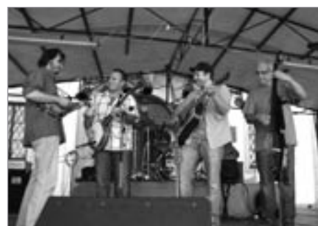
Brněnští Poutníci pokračují v dědictví Roberta Křestana - 40 let hrají své skladby, z nichž o mnoha můžeme říci, že jsou už skladbami našimi.