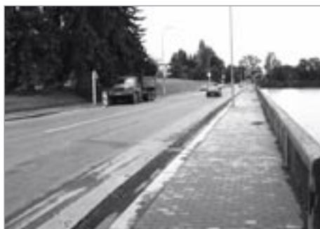
Oprava vozovky na nábřeží