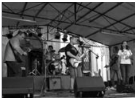
Do větru - známá a letitá svitavská skupina, brající mladě folk a jazz zabájila festival a po nich mladí trubači z Litomyšle rozezvučili náměstí Bobuslava Martinů.