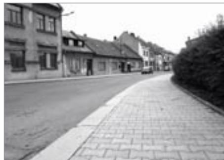
Nový chodík v Husově ulici

V polovině prázdnin bylo dokončeno vydláždění chodníků po obou stranách Husovy ulice a s opravou se bude pokračovat i v Hegerově ulici od kruhového objezdu až po Sídliště Hegerova