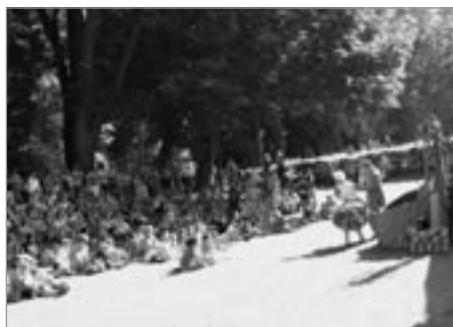
Na útlpný závěr potěšilo divadlo Mrak veselou bříčkou Vodnická pobádka nejen děti.

Domeček Polička je neziskovou organizací zaměřenou na podporu prarodinných aktivit. Organizace byla založena v dubnu 2009 a navázala na činnost denního centra Domeček, kterou dosud zabezpečovalo Dětské informační centrum o. s. Důvodem k založení této nové organizace byla potřeba oddělit registrované sociální služby poskytované DIC o. s. od služeb rodinných.