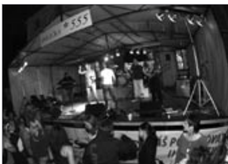
Tvrdá tečka za sobotním večerem byla napsána Hard rock Kafé Bandem Praha ale to Hard v jejím názvu až tak bard nebylo. Skončili v 1 hodinu po půlnoci. A pak se příznivci POPRASKDu posunuli k bradbám, aby se znovu nechal okouzlit Gilgamešem. A bylo jich hodně a vydrželi až do půl třetí do rána.