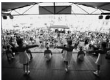
Sobotní odpoledne zabýjaly Mažoretky při Tylově domě a měly spoustu diváků.