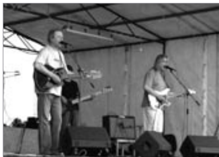
Luboš Pospíšil okouzloval svými romantickými textovými a kytarovými kreacemi.