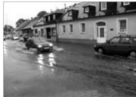
23. srpna v 16.10 zasáhl Poličku desetiminutový prudký liják. Takhle to vypadalo v Husově ulici.