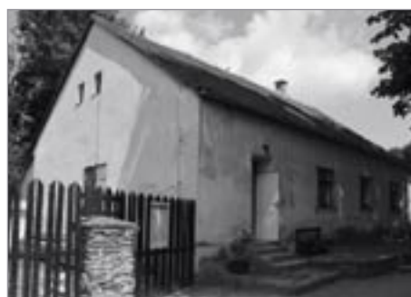
Budova ratejny na Svojanově

Budova bývalé ratejny či myslivny na hradě Svojanov v současnosti slouží jako pokladna a prodejna upomínkových předmětů, provozně-technické zázemí hradu a v části nově vzniká pamětní síň malíře a bývalého kastelána Aloise Živného. Akce obnovy spočívá ve výměně okenních a dveřních výplní, provedení nových fasád a výměně střešních krytin. Novodobý zadní přístavek bude obložen dřevěnými deskami. Všechny práce probíhají tak, aby budově navrátily původní historickou podobu z 2. poloviny 19. století a aby setřely nevhodné novodobé úpravy z 2. poloviny 20. století. Pro další opravy areálu hradu očekává město dotaci z EU ve výši 35 mil.