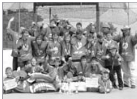
Mladší žáci SK Kometa Polička - bronzový tým MČR 2010