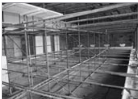
Nezvyklý pohled na plavecký bazén

stalo i na nový povrch chodníku. Město této situaci využilo a vyměnilo sloupy veřejného osvětlení. Pro příští rok bude město usilovat o opravu původního zábradlí.