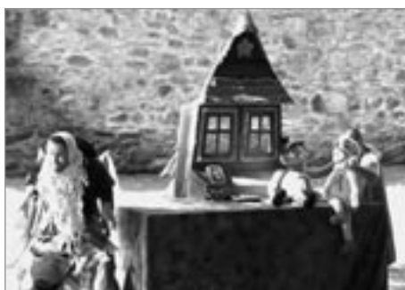
U bradeb brálo odpoledne divadélko Mrak Perníkovou chaloupku.