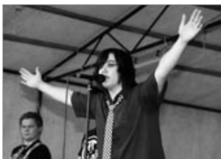
Dirty way svou „břišnou cestu“ pop rockem lemují úspěchy a mladým posluchačům se líbili.