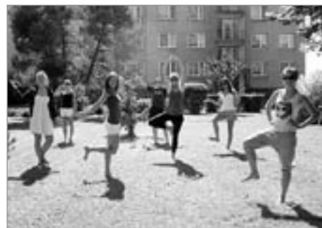
Poličské juniorky – taneční kreační soustředění

Bylo nás víc než vloni, neobyčejných volejbalistek. Ekipa poličských miminek, batolat, holčiček, holek, slečen, paní, dívek a babiček se čtyřmi pořádnými chlapy a dvěma dorůstajícími chlapy se opět vypravila do Čestic, aby se za týden zdokonalila ve volejbalových dovednostech. Letos jsme opět plně obsadili všechny chatky a další prostory, ve kterých jsme si na chvíli