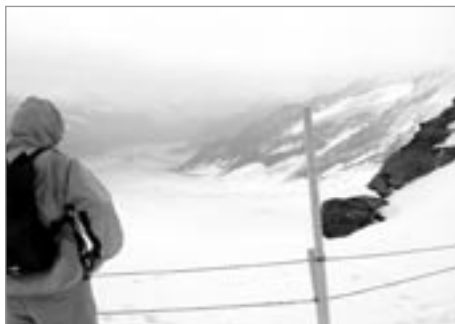
Největší ledovec v Evropě - pod Jungfrau

Byli jsme zde poprvé před 19 lety. V Ženevě jsme tehdy četli zprávy o únosu Gorbačova a o nejistotě, která se opět vznáší nad celou Evropou. Pro lidi jsme působili tehdy - bylo to brzy po pádu železné opony - jako exoti a vycházeli nám velmi vstříc. Naše trasa neměla přesný cíl,