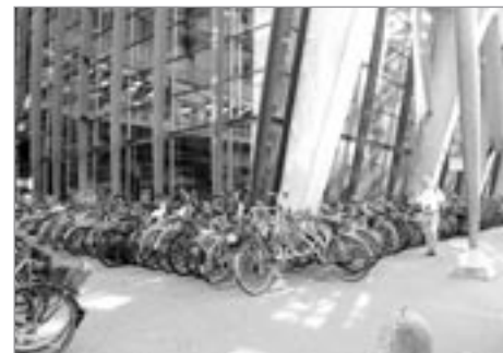
Před nádražím v Luzernu

V Luzernu musí každého zaujmout dvě moderní stavby: veliké nádraží, které si můžete zaměnit za obchodní dům. V prodejně časopisů a novin je čerstvý tisk z celého světa. Naše deníky jsem