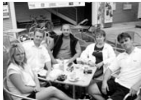
Naši reprezentanti na Mistrovství neregistrovaných hráčů v Prostějově