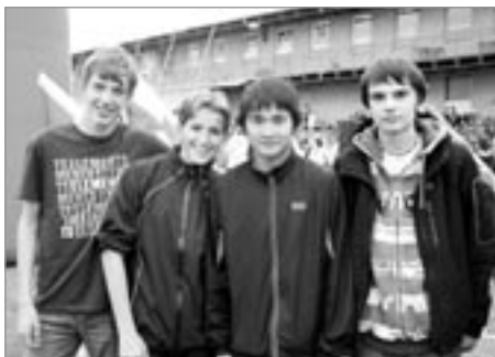
Úspěšný tým na EKAG

a 6. místo za jinak solidní výkon 33,43m bylo velkým zklamáním, protože bronz byl jen přesně metr vzdálen.