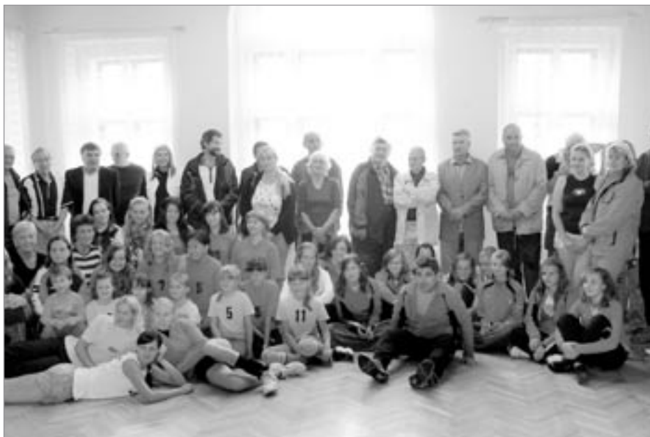
Člání oslav několika generací

Oddíl také poměřil své síly se zahraničními družstvy, mnohdy se museli sklonit Rakušáci, Němci, Polá-