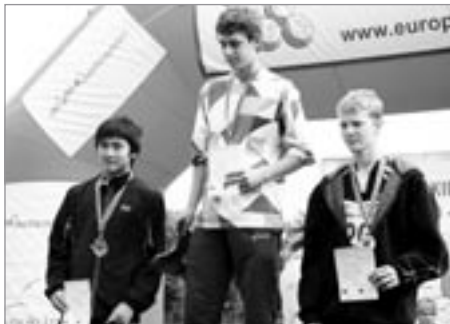
Stříbrný Milan na EKAG

celkem nečekaně výkonem 11,39m v posledním pokuse poskočila z průběžného 5. místa na bronzovou příčku, tím si zajistila nejen místo na stupních pro vítěze, ale i zařazení do reprezentačního výběru pro mezinárodní utkání. Její chvíle ale měly teprve přijít při hodu oštěpem, ale souhra několika nepříznivých okolností v posledních dnech před MČR a obrovská tíha odpovědnosti z tabulkového 2. místa měly za následek, že Terka házela špatně