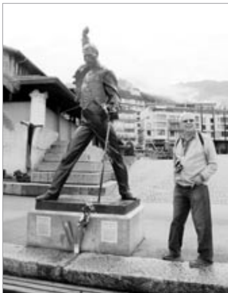
Montreux - Freddie Mercury

vypadá dokonale propracovaný systém spojů a dopravy na alpské velikány. Všechno funguje na minutu přesně, všechno probíhá bez křiku, co křiku - být zvýšeného hlasu a všude, kam máte zapláceno, se pohodlně dostanete. Odměnou je nevyčísitelný zážitek z výšin alpských velikánů a nemusí to být vždycky výhled na ně. Ať jedete lanovkou k Matterhornu, či na masív Mont Blancu (ten je ovšem ve Francii). Na stanici zubačkové dráhy ve výši 3 160m v hoře Eiger chodí po nástupišti zřízenec, má v ruce takovou tu sběrnou pinzetu a do kbelíčku sbírá maličké odpadečky, jestli tam na zemi leží. U nás na Husovce je mnohdy více nepořádku, než v celém Švýcarsku. Na observatoři Jungfraujoch, mezi nebem a zemí, jak praví propagační brožura, je upoutávka na muzeum Alberta Eisteina - neznám tu souvislost s horou, možná zde vyslovil axiom, že dvě věci jsou nekonečné: Vesmír a lidská blbost.