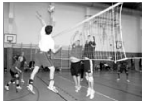
Momentky z turnaje - Čabec a Petr v akci