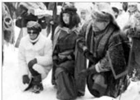
Lonští tři králové, kteří jeli koňmo v čele průvodu a právě se klanějí před jeslami v DPS Penzion.

Milí spoluobčané, až v sobotu 8. ledna v ulicích města Poličky potkáte četné kopie Kašparů, Melicharů a Baltazarů, nelekejte se. Nejde o žádnou hromadnou genetickou manipulaci jako případ u zázračně zrozené ovečky Dolly. Uplynul rok a do Poličky opět dorazila Tříkrálová sbírka.