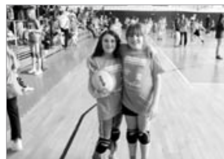
3. místo v oranžovém minivolejbalu v Brně

Náš oddíl absolvoval hned tři turnaje. Nejdříve jsme nenechaly nikoho na pochybách, že patříme k absolutní pardubické špičce a rozebraly jsme si první tři divčí místa na turnaji modrého minivolejbalu v České Třebové.