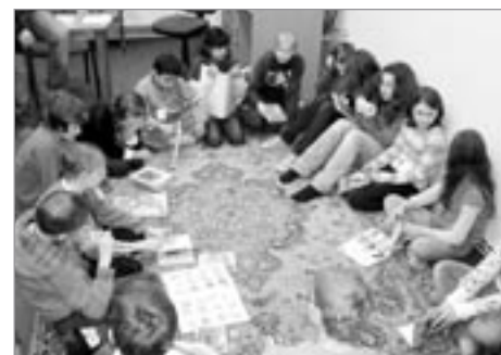
Noc s Andersenem strávilo v knihovně patnáct odvážných mladých čtenářů v kouzelné společnosti svých oblíbených knih