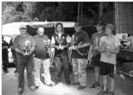
Vítězové soutěže o nejvíce ulovených ryb (centimetrů) - viz konečné výsledky

Na start se dostavilo 50 dvojic, tedy sto účastníků. To je na dnešní dobu malinký zážrak a tak jsme rádi, že jsme závod přece jen uspořádali. Počasí nám docela přálo, bylo teplo, a ten večerní déšť jen příjemně pročistil a osvěžil vzduch. Mys-