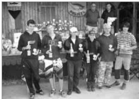
Vítězové v kategorii mládež do 15 let - viz konečné výsledky

Od soboty 4. do neděle 5. června se na přehradě v areálu Rybářského sdružení Vysočina Polička Pod Kopcem konal nejvýznamnější závod jeho letošního sportovního kalendáře – XIII. ročník Poháru Poličský kapr. Jde o závod, který klade na