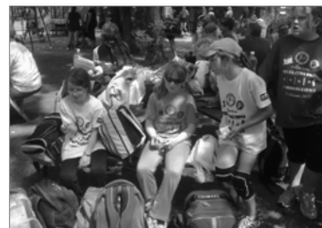
Odpočinek na brněnském turnaji

M. Třebová turnaj vyhrála, ale jako jediná přijela s letošními přebornicemi, které budou hrát příští