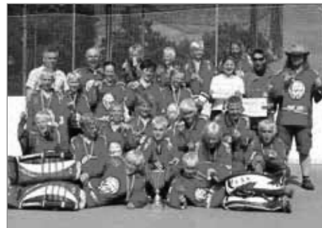
mladší žáci SK Kometa Polička - mistři ČR 2011