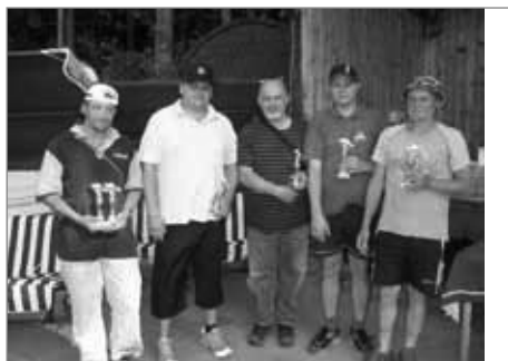
Vítězové v soutěži o největší ulovenou rybu - viz konečné výsledky

účastníky velké nároky nejen pro svou délku (24 hodin), ale vyžaduje i velké soustředění (chytá se