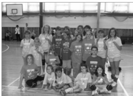
Polička v České Třebové

čtvrté, zelené doplnily úspěch výpravy na šestém místě.