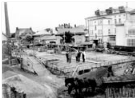
Stavba infekčního pavilonu v srpnu 1938